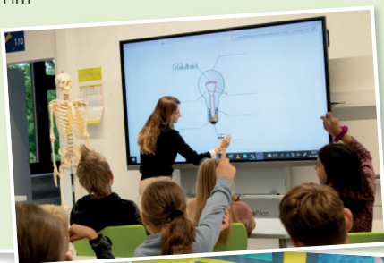
v. l. n. r.: Lernen mit Ipad's, Mensa, moderne Fachräume, Coaching